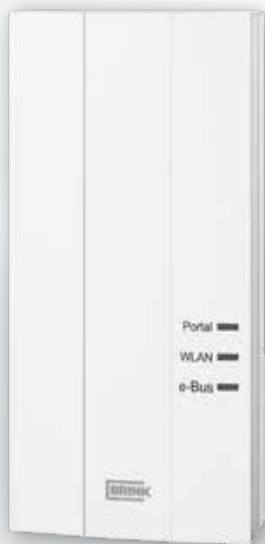
Brink Home Module

Brink Home besteht aus dem Brink Home Module und der Brink Home App, die mit dem Renovent und dessen Bedienungsmodul Air Control verknüpft sind. Die Brink-Geräte der Renovent-Baureihe und die Baureihe Brink Sun Set sind zu diesem Zweck über einen (W)LAN-Router oder den Brink-Portal-Server erreichbar. Darüber hinaus unterstützt das Modul die Steuermodule SM1 und SM2. Die Brink Home App für Smartphone und Tablet gibt es für Android und iOS.